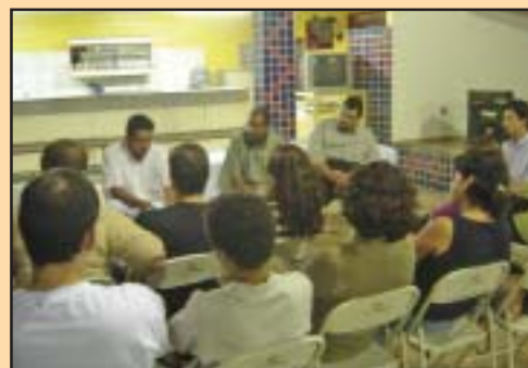
Reunião com companheiros da Fund. Waldemar B. Pessoa

O calendário da diretoria do Sinsauê prevê reuniões, ainda no mês de setembro, com funcionários de outros hospitais de Ribeirão Preto, mas também é certo que os companheiros das cidades da região receberão a visita do sindicato.