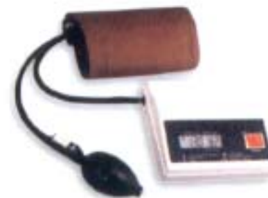
APARELHO MEDIDOR DE PRESSÃO DIGITAL