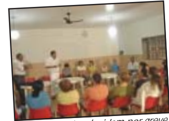
... funcionários decidem por greve

Os companheiros de Tambaú enfrentam uma difícil situação ao longo dos últimos anos devido ao atraso constante no pagamento das folhas salariais. Os trabalhadores acumularam um prejuízo enorme durante esse período em que seus vencimentos vêm sendo pagos "em parcelas", chegando ao limite da paciência e da condição de