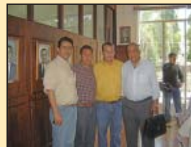
Prefeito de Mococa (camisa xadrez) recebe SINSÁUDE em seu gabinete

O atendimento jurídico do Sinsaúde em Mococa é realizado às quintas-feiras, no Posto do Ministério do trabalho, à rua Coronel Diogo, nº 1737, centro, e compreende as áreas trabalhistas, cível, criminal e previdenciária.