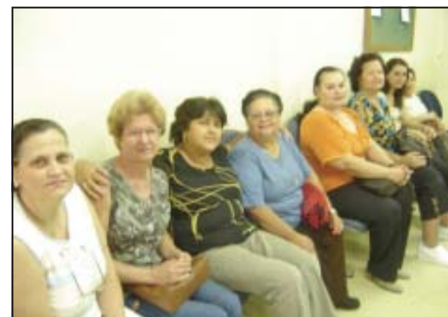
Ex-funcionárias aguardam início de audiência

Na pior das hipóteses, afirmou o juiz, todos receberão seus créditos em outubro de 2006.