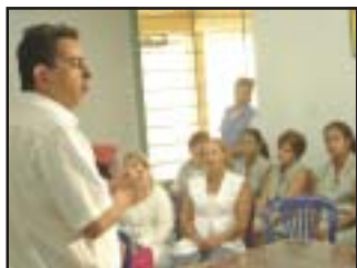
Trabalhadores estavam com aumento salarial atrasado

O Sinsaúde apurou que o Hospital Regional de Divinolândia manteve em atraso o pagamento do aumento salarial referente ao Acordo Coletivo de Trabalho 2004/2005. Assim, por seu departamento jurídico, promoveu reclamação trabalhista junto à Vara do Trabalho de São José do Rio Pardo, visando o pagamento dos valores devidos aos funcionários. Também houve mobilização do presidente e diretores do sindicato junto ao hospital para regularizar a situação salarial o mais breve possível. Essas ações resultaram no pagamento, efetuado em 20 de agosto, aos 275 funcionários do hospital. O valor foi de aproximadamente R$ 78mil, e engloba diferenças salariais e multa de 3%, conforme prevê a cláusula 42ª do ACT, do período de julho/2004 a março/2005, incluindo 13º. Além disso, houve incorporação de 5,57% ao salário de todos os funcionários, retroativo a julho de 2004.