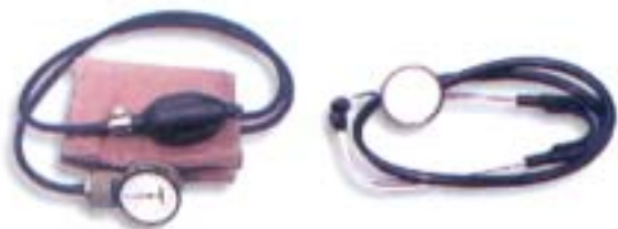
APARELHO MEDIDOR DE PRESSÃO COM ESTETOSCÓPIO

Comércio de equipamentos médicos hospitalares