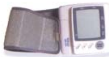
APARELHO DE PRESSÃO SANGUÍNEA