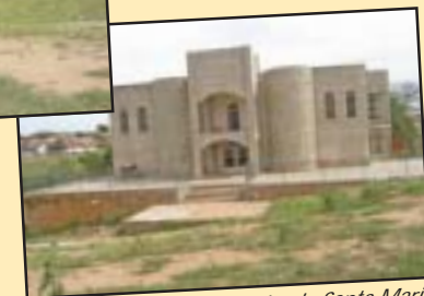
...fica próximo a Igreja Santa Maria dos Anjos