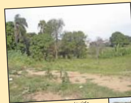
Terreno onde será construída sub-sede...

O antigo curso livre de Instrumentação Cirúrgica passa a ser Técnico em Instrumentação Cirúrgica, necessitando de uma carga horária mínima de 1800 horas, significando 18 meses de curso. Qualquer curso inferior a esse período não é regulamentado pelo Conselho Estadual de Educação, ou seja, o aluno recebe um certificado de participação e não um diploma, como é exigido pela nova Lei. Para os profissionais da área de enfermagem, a Lei determinou que o Curso passe a ser chamado de Especialização em Instrumentação Cirúrgica e tenha duração de 360 horas, ou seja, 6 meses. De acordo com o estatuto da associação, a ANIC, não pode ser reconhecido como profissional o aluno que não está matriculado em curso regularizado, conforme informação acima. Infelizmente muitas escolas, em interesse próprio, não se adaptaram à nova Lei e continuam ministrando o curso de forma livre, indiscriminadamente. É uma pena que depois de tanta luta para padronizar a qualidade dos cursos e melhorar o mercado de trabalho, ainda existam pessoas que insistem em banalizar a profissão.