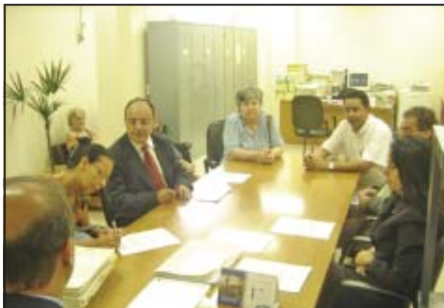
Pagamento foi realizado na Vara de Execuções

Os ex-funcionários que ingressaram ação trabalhista contra a Santa Casa de Ribeirão Preto, através do departamento jurídico do Sinsaúde, já começaram a receber seus créditos.