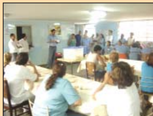
Reunião com companheiros da Beneficência Portuguesa